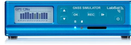
LabSat 3 Wideband